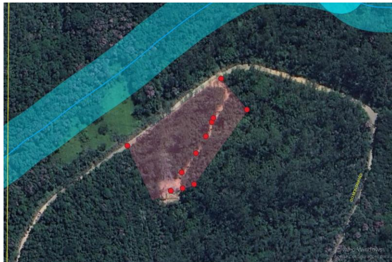
17 - Imagem QGIS com polígono da área afetada – Pontos marcados no GPS.