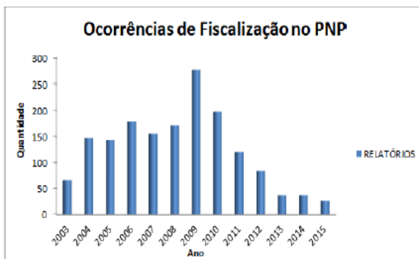
Gráfico 5: Ocorrências de fiscalização no PNMP entre 2003 e 2015.