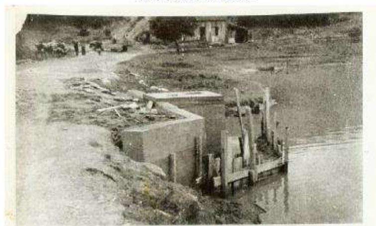
Figura 9: Construção da caixa de registro e barragem da Lagoa do Pedroso, no alinhamento da Estrada para Santo André (depois Estrada do Pedroso) para o vertedor à esquerda para o reservatório Billings, 1955.