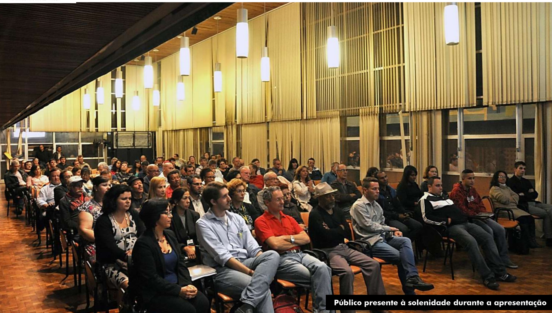
Público presente à solenidade durante a apresentação