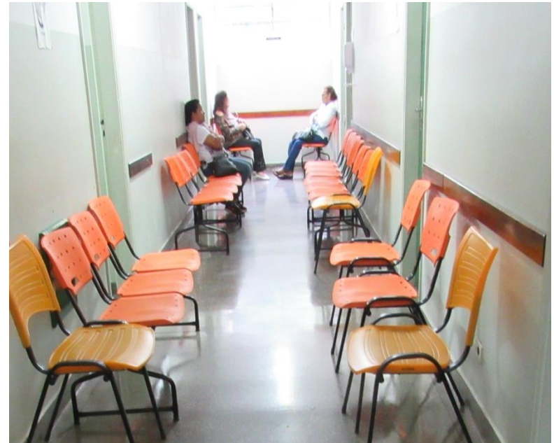
Centro de Especialidades I