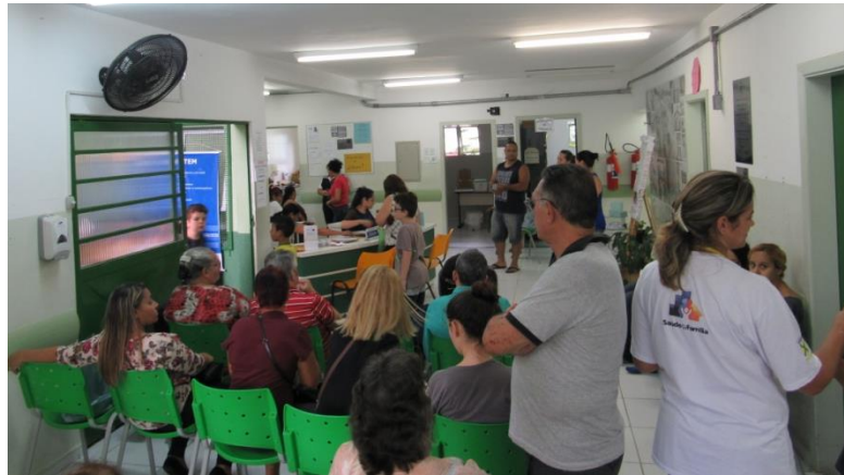
U.S. Centre Ville