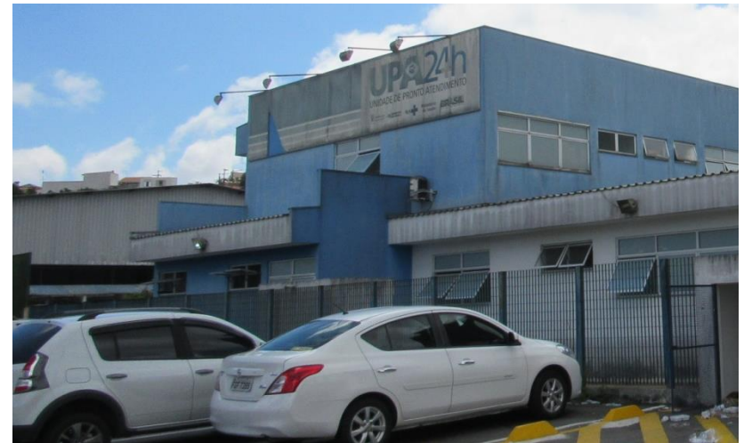
UPA Sacadura Cabral