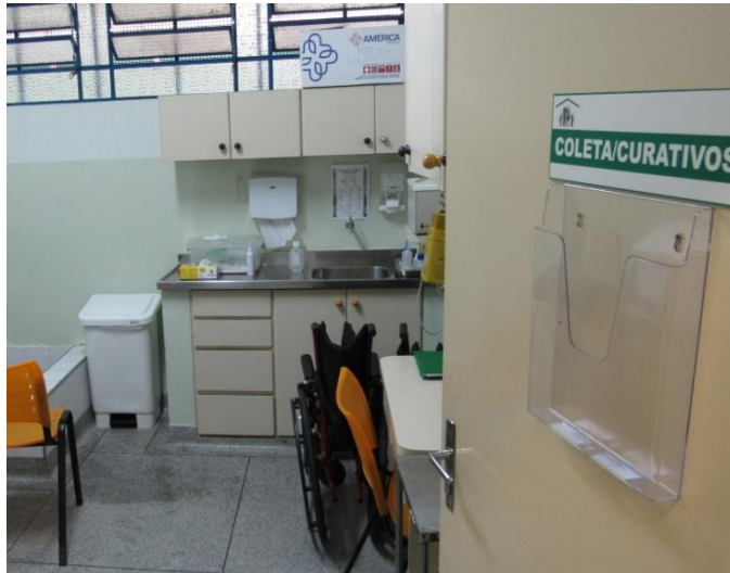
U.S. Vila Linda