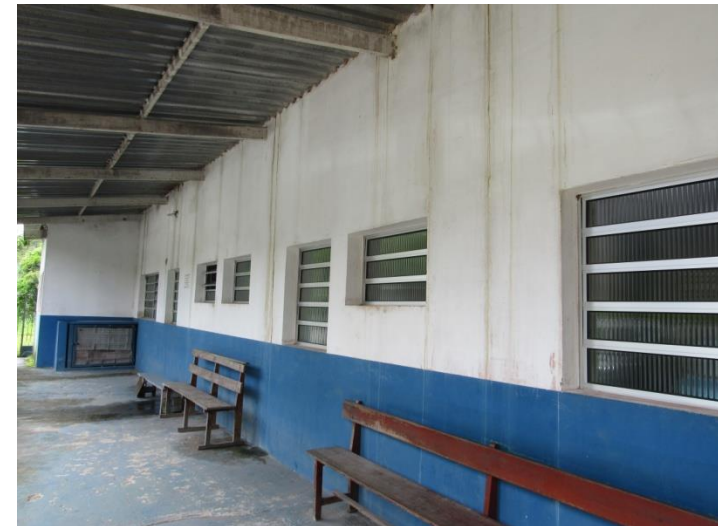
U.S. Jardim Santo André