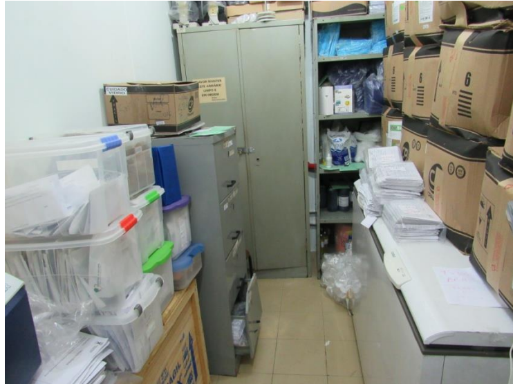
U.S. Vila Guiomar