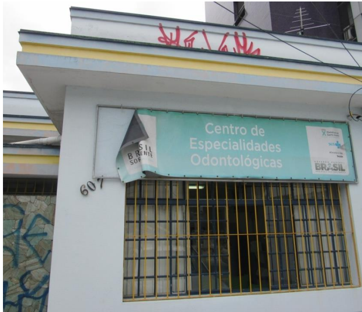
Centro de Especialidades Odontológicas