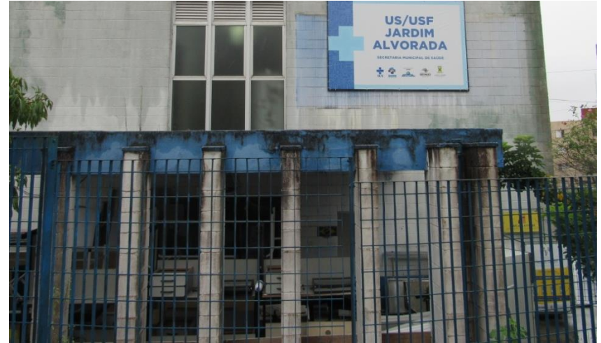
U.S. Jardim Alvorada