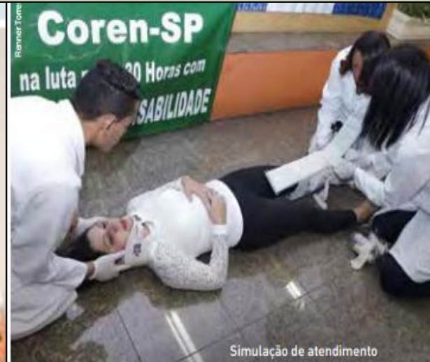
Simulação de atendimento