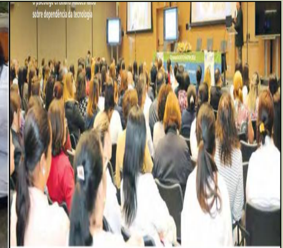
o privilégio de sentir renovar a vida sobre dependência da tecnologia